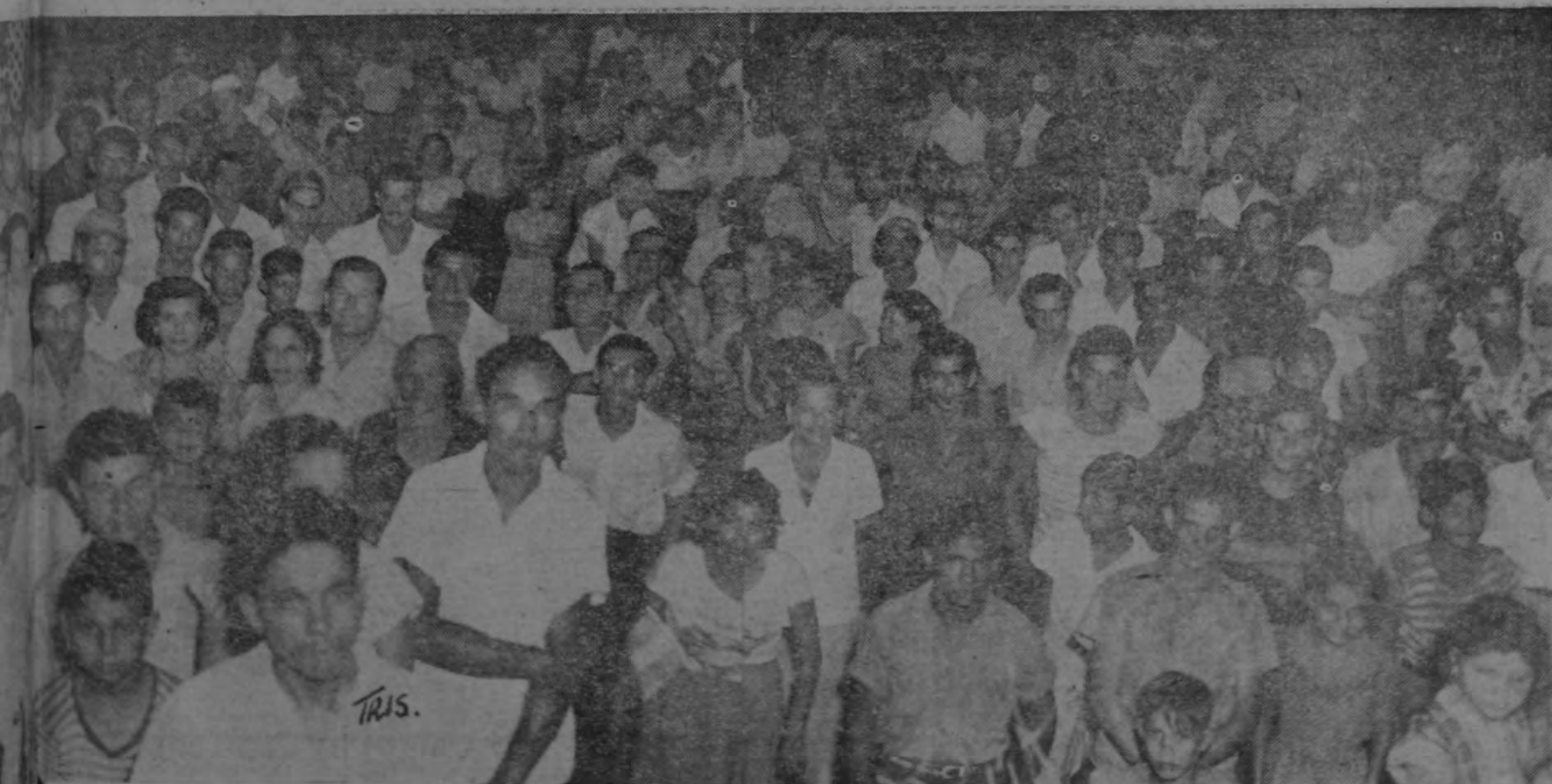
HE A LA QUE ASISTIERON 1.000 GOLFITEÑOS

on José Figueres se refirió a la... por medio de la máquina. En... n exhortó a los trabajadores a... tos democráticos, ofreciéndoles... u importante discurso en el que... sición frente al mundo occiden... on los Estados Unidos, será re... e en nuestras páginas políticas