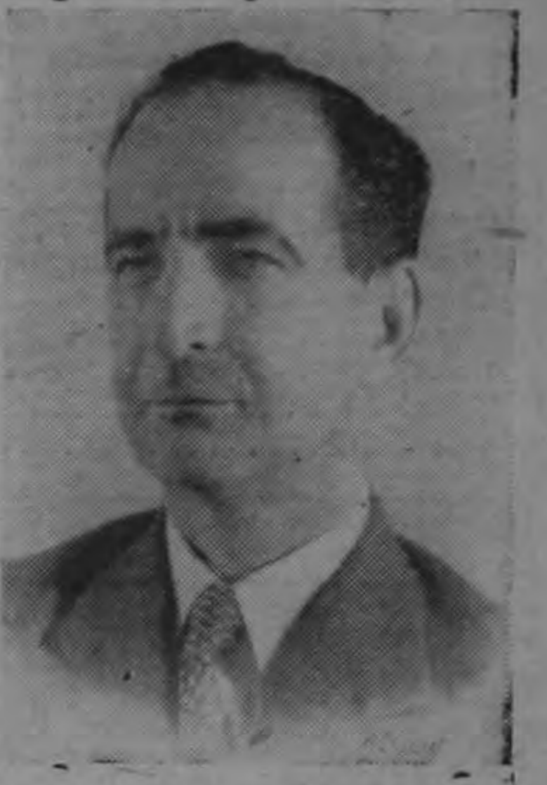
Compañía Bananera de Costa Rica, subsidiaria de la United Fruit Company, Figueres respondió con un inequívoco "no". Dió un desmentido similar a los rumores de que nacionalizaría las grandes plantaciones de café o los "beneficios", o las grandes plantaciones y molinos de azúcar, y los grandes ranchos ganaderos. Respecto a la crianza de ganado dijo que Costa Rica puede y debe transformarse en exportadora de carne de vacuno por medio de los esfuerzos de los propios ganaderos, con ayuda de los organismos del Estado.

Respecto a las compañías de Tabaco de propiedad extranjera y nacional, Figueres dijo:—"No pensamos en nacionalizarlas. Lo mismo se aplica a la Compañía Nacional de Luz y Fuerza que es parte de la red de la Electric Bond & Share Co. Primero tenemos que construir nuevas plantas de energía eléctrica". Al preguntarle si pensaba nacionalizar la poderosa