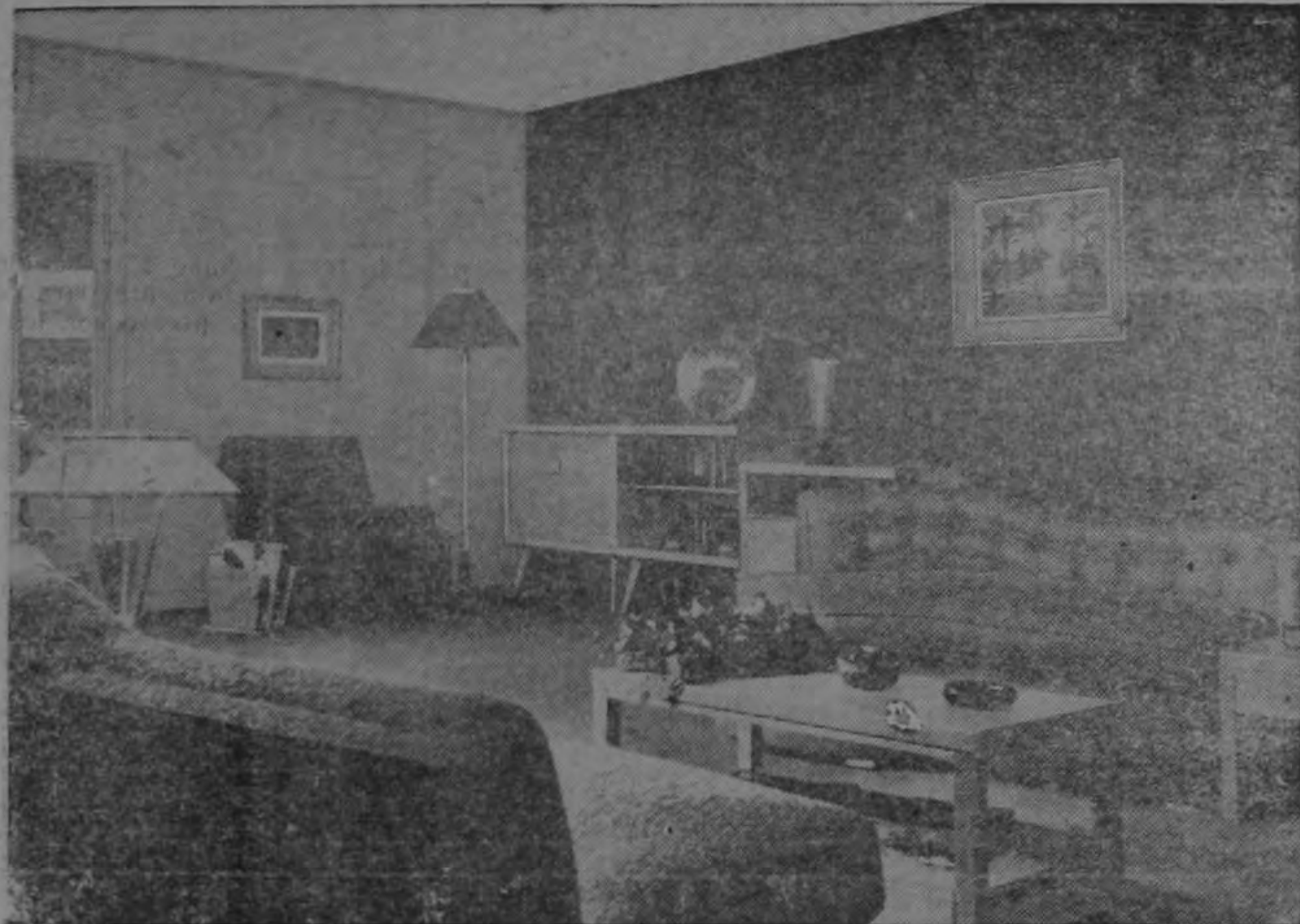
Esta sala fué pintada con la maravillosa pintura Super Kem-Tone, de Sherwin Williams en los colores Parklane Green y Chartreuse, para crear un conjunto armónico y elegante.